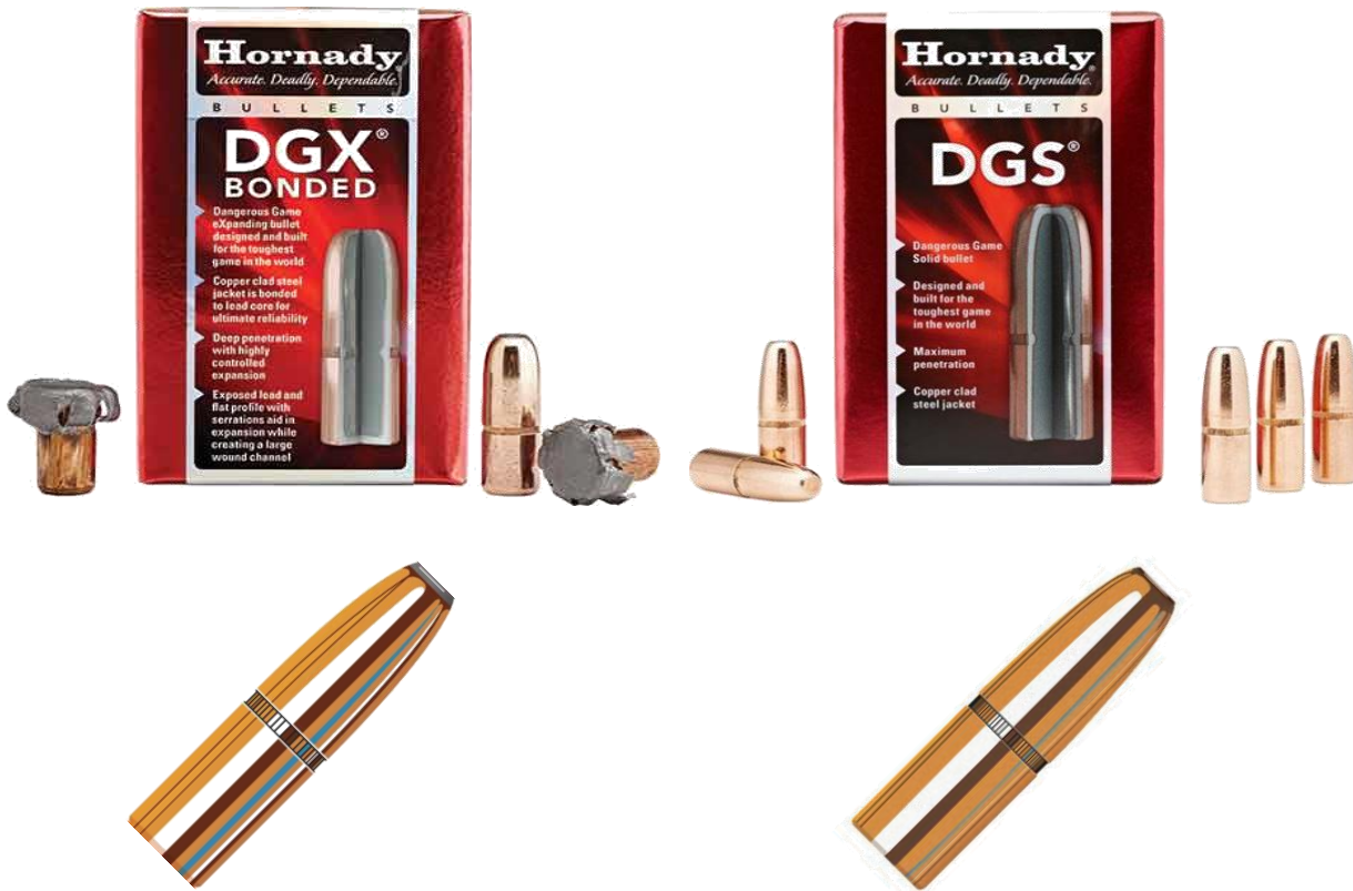
Hornady projektiler til storvildtsjagt

Her har jeg valgt DGS som er en fuldkappet kugle og DGX som er en blødnæset bonded kugle. De har nøjagtig samme vægt og ballistic coefficient, hvilket betyder, at man uden besvær, kan lade dem til samme trefpunkt. De virker særdeles godt til bøffel, elefant og næsehorn. Til andet større vildt er de fuldt anvendelig.