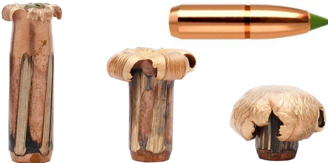
Nosler Lead Free projektil

Form og ydelse i klasse med de bedste projektiler fra Nosler. Projektillet opfylder kravet til en høj BC på højde med den normale Nosler Accubond, en kontrolleret ekspansion og næsten altid gennemskud. Den nye Nosler Lead Free er en blyfri kugle, hvor der ikke er gået på kompromis med nøjagtighed, udvidelse eller penetration. Der blev lagt mange, mange timer i hvert trin i udviklingsprocessen, der førte til et unikt blyfrit projektil. Prøverne viste, at den forbrugte tid på udvikling virkelig kunne betale sig. Ekspansionen er utrolig ensartet, og projektillet bevarer mindst 95% af sin vægt. Opfylder alle krav til blyfri, bl.a. i Californien, hvor man har de skappeste krav til blyfri projektilers renhed. Kræver dog høj hastighed for at opnå fuld ekspansion. Bemærk leveringsvanskeligheder med produkter fra USA.