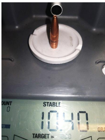
308 Win. Før

Perfekt ekspansion og som regel 100% restværdi.